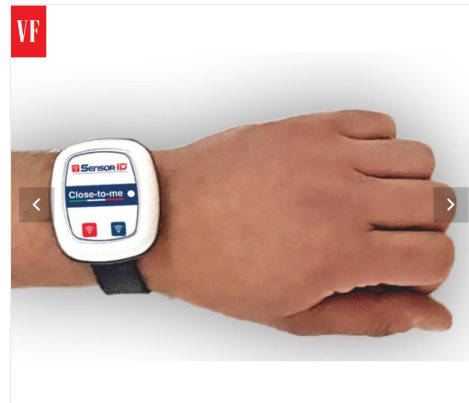
CLOSE-TO-ME Wristband

Sebbene questi accessori siano disponibili a prezzi piuttosto differenti tra loro, alcuni produttori offrono soluzioni ad hoc per le imprese in base al numero dei dipendenti e delle unità da implementare. Da K-Y-D a Safe Spacer, nella gallery di questo articolo potrete sfogliare alcune fotografie di questi dispositivi.